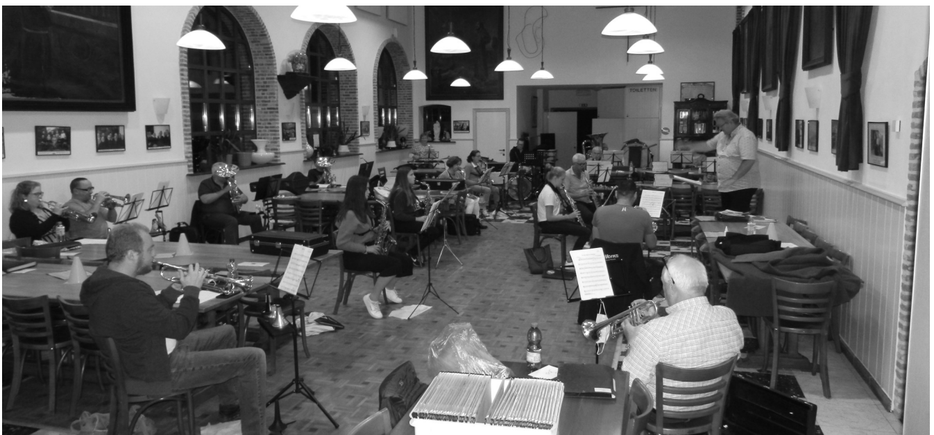
Een corona-repetitie, ver van elkaar maar, beter dan niets.

Donderdagavond is het repetitieavond en al van in de jaren stillekes is die avond gereserveerd voor de fanfare. Altijd een rush om er op tijd te geraken, maar zalig tot rust komen als de muziek begint. Tijdens de pauze even bijpraten met de medemuzikanten bij een pintje of iets fris. De dorpsniewtjes bespreken en ieders wel en wee. Raar is het dan om gewoon thuis te zitten, rustig, dat wel, maar verstoken van de wekelijkse portie sociale contacten. Uw instrument staat vast te roesten wegens geen doel om te repeteren. Er werden wel enkele initiatieven genomen om toch in gang te blijven: online repeteren, samen een muziekstuk blazen, ieder van thuis uit en met de computer samenvoegen tot één muziekwerk, je lievelingslied op muziek laten zetten door de dirigent, zodat je het thuis kan spelen. Allemaal leuk en aardig, maar niet hetzelfde als samen repeteren en samen optreden. Je mist de kick en de voldoening van een geslaagd optreden waar je met z'n allen naartoe hebt gewerkt. Ook ben je als muzikant van een muziekvereniging bij veel feestelijkheden en gebeurtenissen in het dorp aanwezig om alles op te fleuren met een streepje muziek, niets van dit alles. Ook de opleiding van onze jonge muzikanten moest